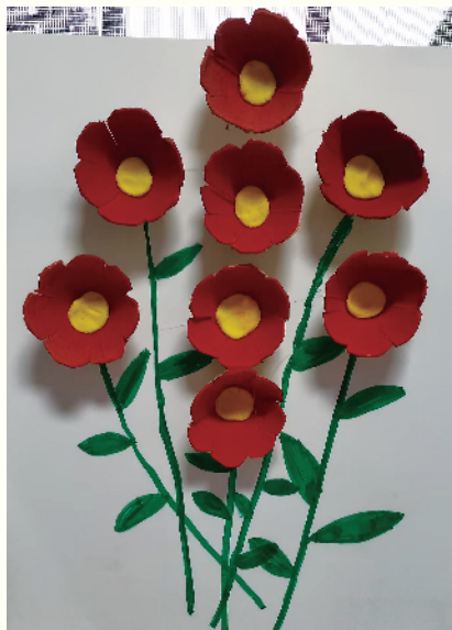
小记者：尹米诺 周口市汉阳路学校五(5)班 辅导老师：孙成荣